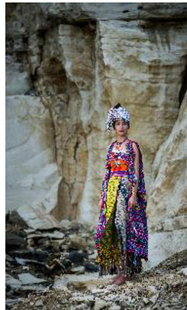
Karya Foto 4. “Kefamu Ayutopas” Digital Print on Photo Paper 60 x 40 cm, 2018

Busana yang dikenakan model merupakan busana artwear karya Oerip Indonesia yang dibuat dengan memadukan tiga wastra dengan motif dan makna yang berbeda. Ketiga wastra tersebut adalah Tenun Kefa Soe khas Nusa Tenggara Timur dengan motif bunga padi yang melambangkan keberhasilan panen, tenun Ayutopas khas desa Ayutopas yang berbahan dasar kapas bermotif manusia purba yang melambangkan penghormatan pada para leluhur, Serta wastra tenun Amaunban kuning bermotif bunga-bunga khas dari suku etnis Amanubang yang melambangkan perempuan yang cantik. Pemotretan karya fotografi ini berlokasi di Telaga Biru, Gunung Kidul, Yogyakarta.