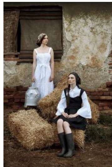
Project for DIVA Magazine