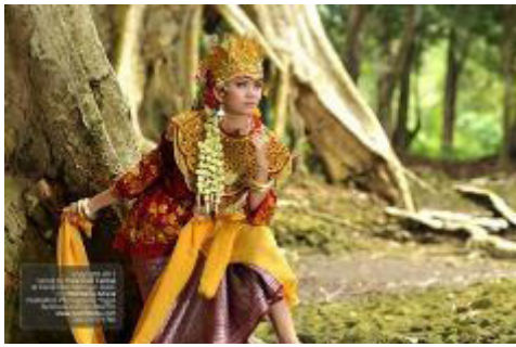
Foto model wanita dengan Pakaian Pengantin adat Jambi

Sumber: http://model.poetrafoto.com/ diakses pada 11 Desember 2018