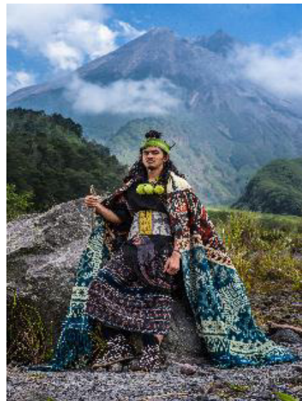
Karya Foto 1. "Maumere Umalulu" Digital Print on Photo Paper 75 x 50 cm, 2018

menampilkan model yang mengenakan busana wastra karya Oerip Indonesia. Hal ini dimaksudkan supaya foto terlihat lebih menarik.