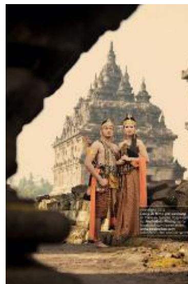
Ramayana prewedding photoshoot in Candi Plaosan

Mishbahul Munir merupakan pendiri Poetra Foto yang berbasis di Yogyakarta. Selain itu, Munir juga merupakan redaktur pelaksana dari majalah Suara Pandanaran . Walaupun aktif sebagai fotografer wedding , beberapa karya fotografi modeling yang dibuatnya pun menarik untuk dijadikan acuan karya. Berikut ini beberapa karya Mishbahul Munir.