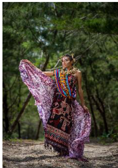
Karya Foto 3. “ Melolo Lembata Sasirangan ” Digital Print on Photo Paper 40 x 60 cm, 2018

Pemotretan pada karya foto-2 dilakukan menggunakan kamera DSLR Nikon D750 dengan pengaturan kecepatan rana 1/200 \text{ sec} pada ISO 200 . Pemotretan ditunjang dengan penggunaan lensa Nikon 24-70mm f/3.5 N yang diatur pada focal length 70mm dengan bukaan diafragma sebesar f/10 . Pencahayaan pada karya didapatkan dengan penggunaan dua lampu flash yang diletakkan pada sudut 315^\circ sebagai main light , dan pada sudut 225^\circ sebagai fill-in light .