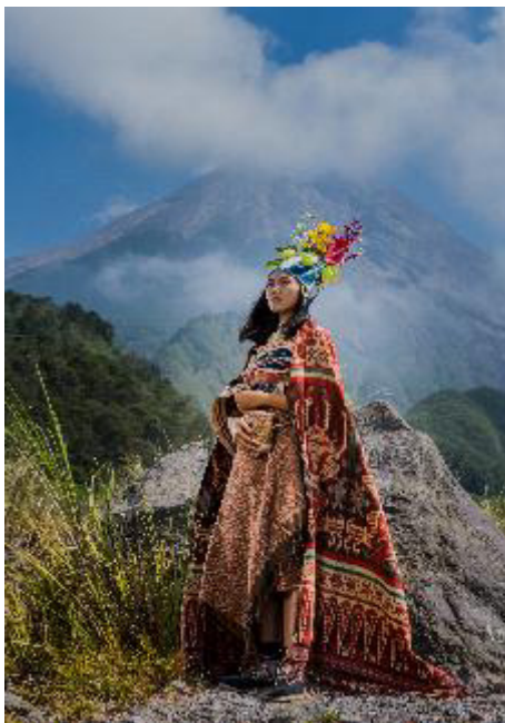
Karya Foto 2. “ Humba Iban ” Digital Print on Photo Paper 75 x 50cm, 2018

Pemotretan pada karya foto-1 dilakukan menggunakan kamera DSLR Nikon D750 dengan pengaturan kecepatan rana 1/200 \text{ sec} pada ISO 200 . Selain kamera, pemotretan juga ditunjang dengan penggunaan lensa Nikon 24-70mm f/3.5 N yang diatur pada focal length 70mm dengan bukaan diafragma sebesar f/10 . Pencahayaan didapatkan dari dua lampu flash yang diletakkan pada sudut 315^\circ sebagai main light , dan pada sudut 225^\circ sebagai fill-in light .