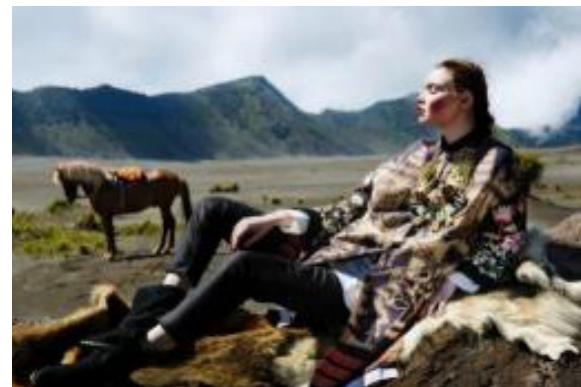
Karya Nicoline Sumber: http://nicolinepatricia.com , diakses pada 10 September 2018

Nicoline Patricia Malina merupakan salah satu fotografer fashion asal Indonesia yang pernah memenangkan Iconique Societas Excellence In Photography Award 2007 . Berikut ini dua karya Nicoline yang menjadi acuan karya.