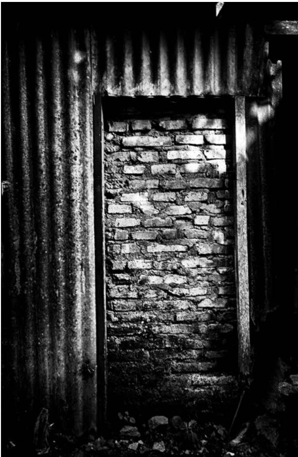
Gambar 4. "Ditutup", 60x40cm, (2015).