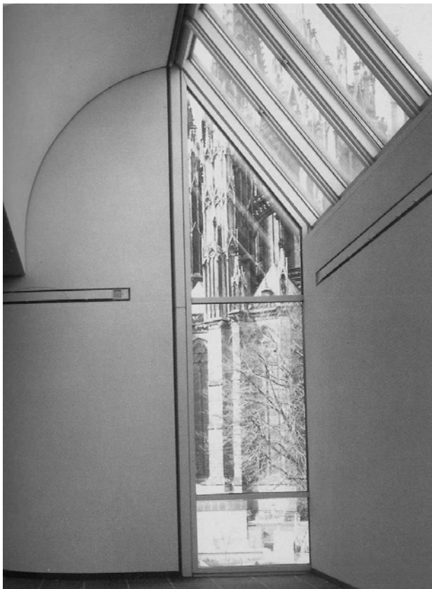
Gambar 2. Foto Acuan, Karya Schmölz K.H. (20th Century Photography, 2000:605)

lain sebagainya. Karya fotografer tersebut memberikan pengaruh dalam mewujudkan karya foto “dimensi spasial sebagai metafora keberjarakan diri melalui medium fotografi ekspresi”.