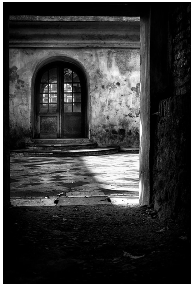
Gambar 5. "Terasing", 60x40cm, (2015).

Selanjutnya (gambar 5) pintu kecil menuju bangunan lain yang berlapis-lapis pintu masuknya. Membuat setiap orang atau siapa saja yang masuk ataupun ingin masuk harus melewati lapisan-lapisan pintu yang mengisolasi dari keriuhan yang ada di luar. Membukanya pun hanya bisa dilakukan dari dalam. Demikian juga dengan kita, untuk kita masuk ke dalam diri saja perlu melawati beberapa tahapan dan setiap tahapan itu mengasingkan kita dari dunia luar serta dari dunia kasar. Sebab yang ada di dalam itu terisolasi oleh keriuhan dunia luar dan dunia kasar. Mengetahui diri atau pribadi sendiri itu hal yang paling sulit dan tidak semua dari kita yang mengetahui secara utuh diri atau pribadi kita.