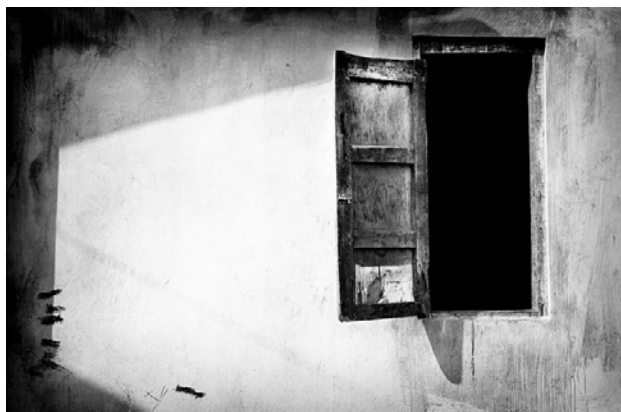
Gambar 6. "Ruang Gelap", 90 x 60 cm, (2015).

anak, kakak, adik, kerabat, dan asisten rumah tangga. Sambutan khas di rumah membuat kita menyikapi dengan kerinduan, kemarahan, bahkan kebencian untuk kembali ke dalam rumah. Setiap diri adalah rumah bagi dirinya sendiri tak luput juga, orang tua adalah rumah bagi anak-anaknya. Rumah mempunyai peranan yang sangat vital bagi kita untuk bersosialisasi dengan yang lebih luas lagi cakupannya. Bagaimana kita di dalam rumah, bagaimana kita mengambil sikap di dalam rumah sebagai salah satu bekal yang kita bawa untuk bersosialisasi dengan komunitas yang lebih besar.