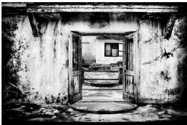
Gambar 7. "Sambutan Rumah", 90 x 60 cm, (2015).

Terlampau menutup atau menarik diri ke dalam juga tidak baik. Seimbang dan selaras dalam mengambil sebuah sikap, menarik diri dari dunia luar seperti tinggal di dalam goa. Pancarkan apa yang ada di dalam diri, keluarlah dengan penuh keyakinan tanpa pernah sedikitpun merasakan keraguan. Siapa yang akan mengenal kita kalau kita menarik