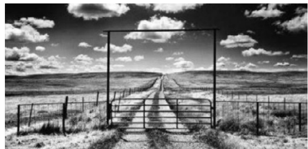
Gambar 1. Foto Acuan Karya Roman Lorang, "Fractal Dreams" (Focus Magazine, 2011:91)

Roman Lorang melakukan eksplorasi (gambar 1) terhadap komposisi framing yang menempatkan elemen garis sebagai objek utama dengan membingkai pemandangan