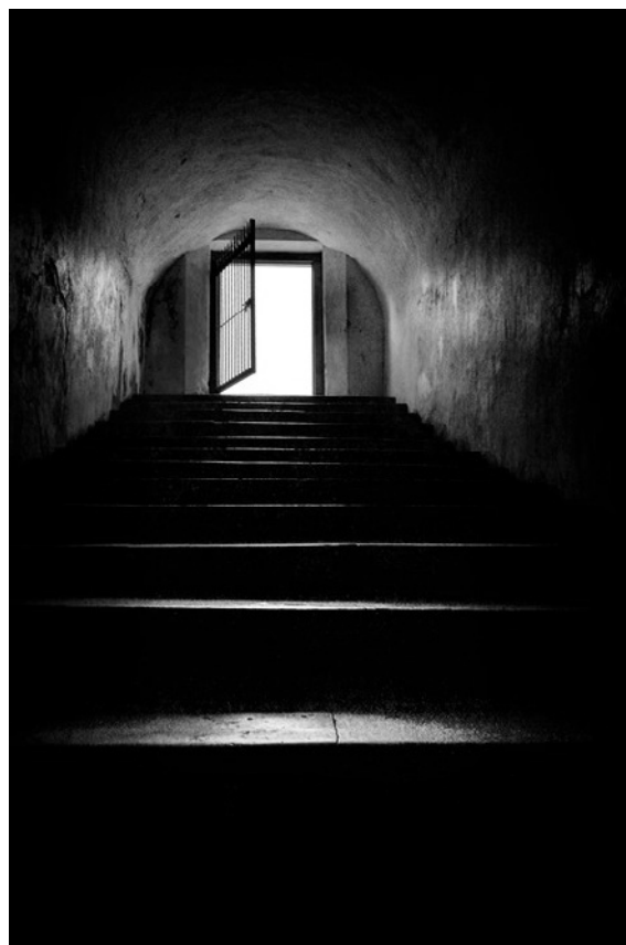
Gambar 8. "Terbukalah", 60 x 40 cm, (2015).

diri dari dunia luar? Lantas apa guna kita terlempar ke dunia? Bukankah setiap kita adalah unik adanya, maka tunjukkan setiap keunikan kita dengan menerima keunikan dari orang lain (di luar diri). Terbukalah untuk setiap perubahan dan merubah, pilihannya hanya dua yakni, mengubah atau diubah; dinamis atau statis. Bagaimana kita dapat diterima oleh orang lain kalau kita saja tidak menerima orang lain.