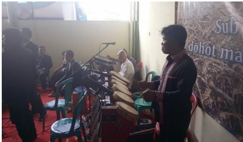
Gambar 8. Instrumen Taganing (foto: Nova Oktaviana Tinambunan, 8 Oktober 2023)

tergantung pada kebutuhan, tetapi hasil penelitian pada tanggal 8 Oktober 2023 pukul 11:00 WIB alat musik yang digunakan yaitu, Taganing , Sulim , dan Keyboard . Instrumen yang digunakan oleh grup Duma Musik ialah tiga instrumen yang akan dijelaskan sebagai berikut.