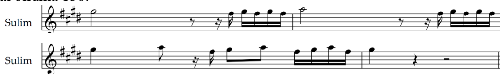
Notasi 6. Melodi Bagian Coda Gondang Mangaliat .

Ending atau biasa disebut coda pada Gondang Mangaliat , berada pada birama 127 sampai birama 130.