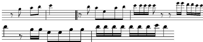
Notasi 2. Pola Permainan Sulim pada birama 1 sampai 5.

repertoar Gondang Mangaliat mempunyai peranan yaitu sebagai pembawa melodi pokok yang menghasilkan karakter warna suara yang khas. Berdasarkan video hasil penelitian, Sulim mulai dimainkan pada birama pertama setelah diawali atau dibuka oleh instrumen Taganing dan Keyboard . Sulim Batak Toba identik dengan teknik permainan jari yang membuka tutup lubang dengan cepat seperti melompat-lompat yang disebut Pilitik dan juga menggunakan teknik mambunga-bungai yaitu teknik improvisasi nada selama beberapa ketuk dalam birama tersebut, agar terciptan nada hiasan pada sebuah lagu yang bertujuan untuk transisi atau lead in .