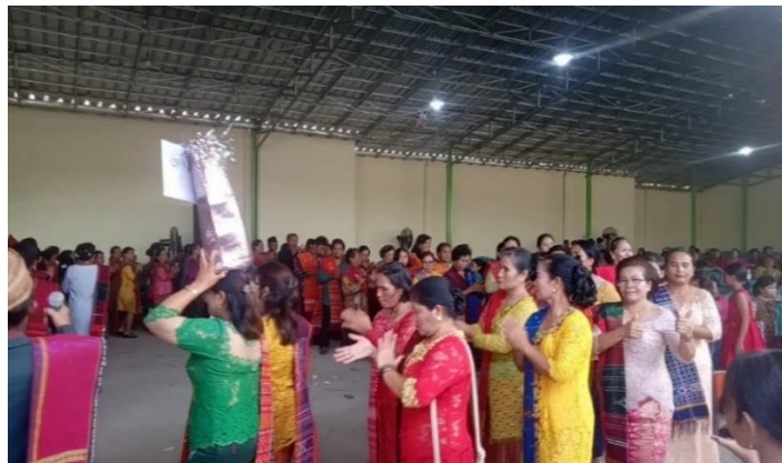
Gambar 7. Jemaat pada saat manortor berkeliling membawa silua .

Seperti Gondang Mangaliat yang disajikan dalam acara adat pernikahan berbeda dengan yang disajikan dalam konteks panen padi. Arti istilah diketahui bahwa Gondang Mangaliat yaitu Gondang Liat-liat yang berarti melingkar, arti melingkar sesuai dengan kesenian manortor yang selalu disajikan dengan cara berkeliling dan melingkar. Contoh berkeliling dan melingkar dapat dilihat pada gambar berikut: