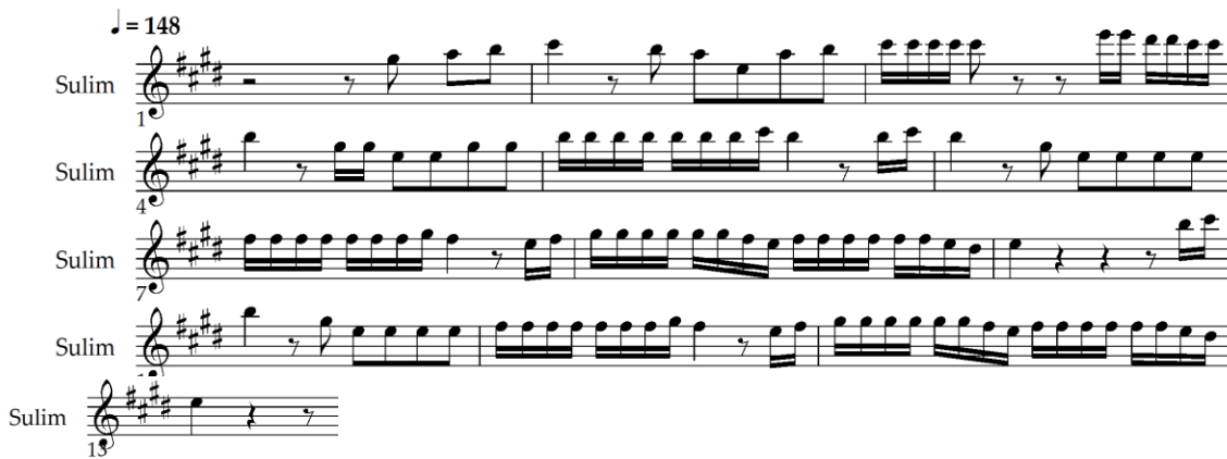
Notasi 3. Melodi Bagian A Gondang Mangaliat

Pada bagian A memiliki 13 birama, terdapat periode yang terdiri dari kalimat tanya dan kalimat jawab, dimana masing-masing kalimat tanya dan jawab tersebut juga terdiri dari motif yang menyusunnya. Deskripsi periode pertama pada bagian A yaitu dari birama 1 sampai birama 13.