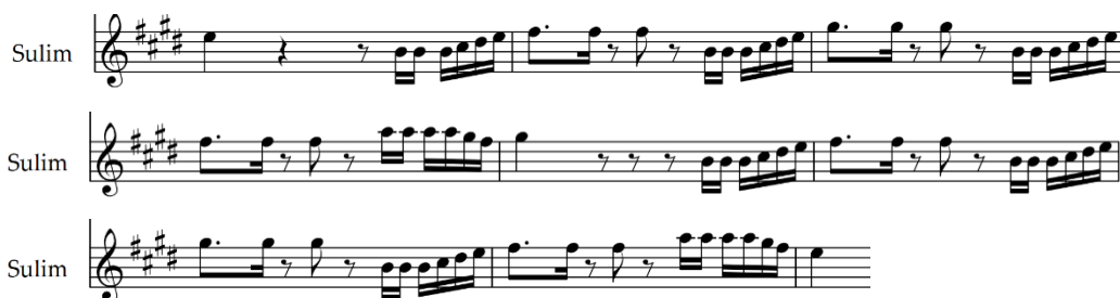
Notasi 4. Melodi Bagian B Gondang Mangaliat