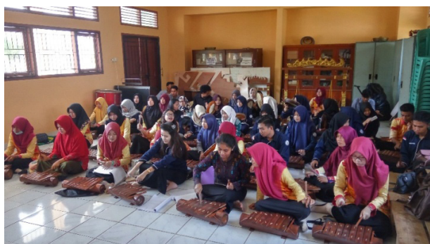
Gambar 2. Ansambel Gamolan.

Pada penelitian yang dilakukan terhadap ansambel string diketahui memberikan dampak