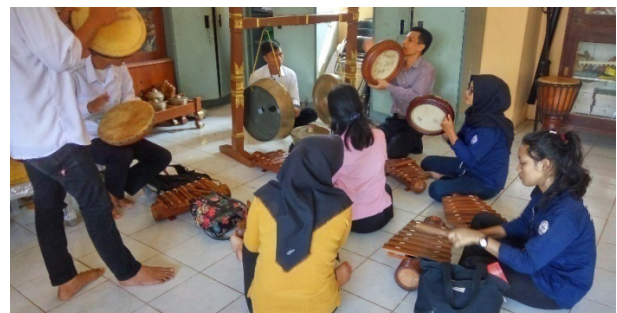
Gambar 7. Kelompok Kecil Latihan Gamolan.

Kekompakan yang terbentuk dari latihan musik gamolan merupakan output tertinggi dari proses interaksi sosial. Kerja sama yang terbentuk dari kelompok pemain musik gamolan merupakan bentuk relasi sosial yang bersifat asosiatif. Di dalam aktivitas bermain musik secara berkelompok baik langsung maupun tidak langsung, terdapat proses sosial untuk mencapai tujuan yang sama. Selain