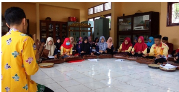
Gambar 6. Pelatih Mendemonstrasikan Tabuhan yang akan dilatih.

Permainan musik gamolan secara berkelompok bukan hanya untuk menghasilkan musik yang harmonis saja, tetapi dapat dijadikan bentuk latihan berinteraksi antar pemainnya. Tugas dan tanggung jawab setiap pemain merupakan pedoman untuk bekerja sama dalam permainan musik ini. Sehingga dalam interaksi yang terjalin dalam kelompok ini dapat membentuk kerja sama asosiatif. Hasil penelitian ini juga membuktikan bahwa seni tradisional apabila dilakukan secara komunal dapat mempertahankan identitas budaya asli dari perkembangan teknologi (Haryono & Soedarsono, 2010).