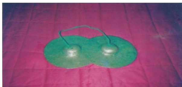
Gambar 5. Khujih.