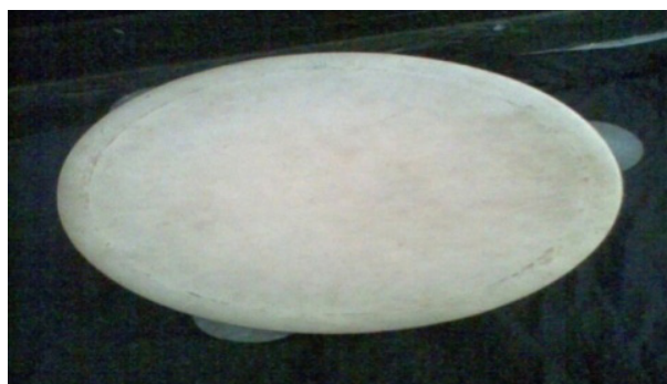
Gambar 3. Rebana. (Foto: Kurniawan, 2017)