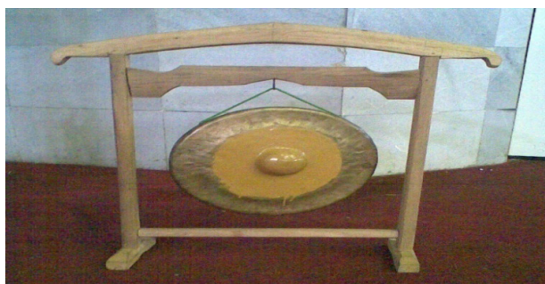
Gambar 4. Bende.