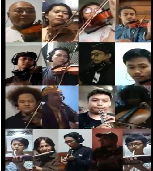
Gambar 3: Screen shoot bentuk video virtual dan link googledrive .

kedalam sebuah karya seni. Untuk lebih jelasnya dapat dilihat dan didengarkan pada link google drive di bawah ini: