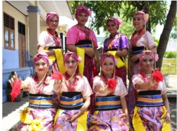
Gambar 4: Berbagai macam warna klambi pada anggota Sanggar Asem Gede. (Foto: Irayanti, 2017 di Losarang)

Untuk itu, karena terkesan sederhana dengan klambi yang berbahan kain batik yang serupa dengan bahan kain dengan tapih , maka klambi tersebut dikembangkan menjadi sesuatu yang berbeda