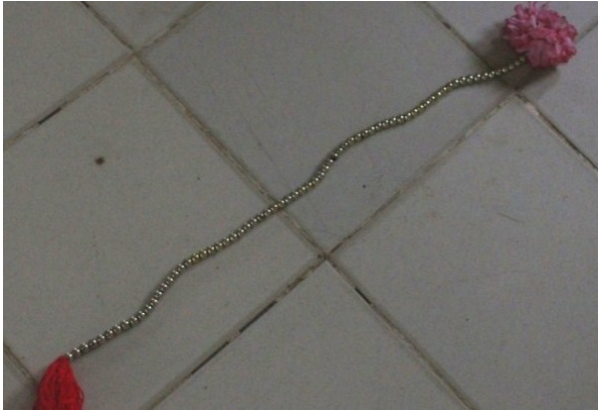
Gambar 1: Sumping atau rawis properti Tari Trebang Randu Kentir. (Foto: Irayanti, di Losarang 2017)