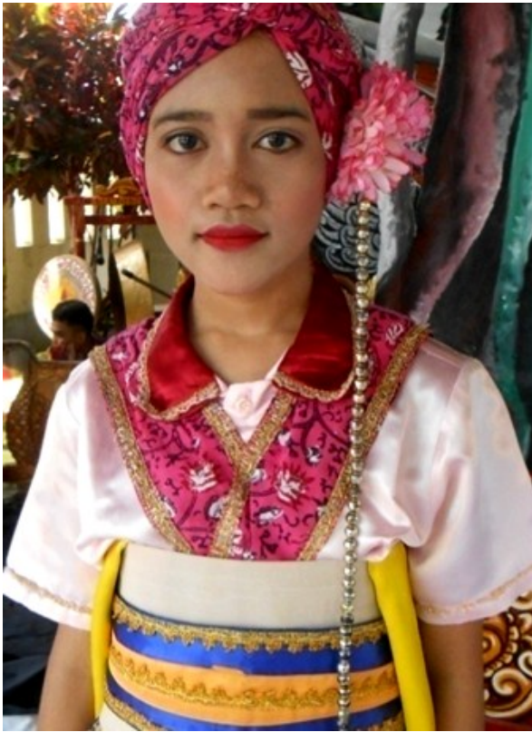
Gambar 3: Rias dan busana penari Tari Trebang Randu Kentir.