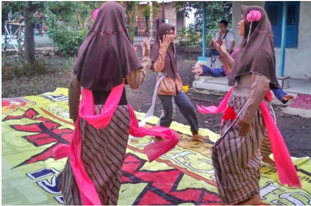
Gambar 5: Proses latihan di luar sanggar secara mandiri oleh siswi-siswi SMP.

Pelatihan non formal diajarkan biasanya bertempat di dalam rumah Dede Jaelani dan di pelataran rumah warga terdekat dari sanggar. Pelatihan tari non formal dilaksanakan ketika jam pelajaran sekolah telah usai, biasanya pada hari senin-jum'at itu sekitar jam 15.00-17.00 WIB dan jika hari libur, dilaksanakan pada jam 13.00-16.00 WIB.