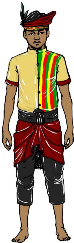
Gambar 4. Rancangan Busana Penari (gambar : Oka, 2016)

dimaksudkan bahwa antara kostum bagian atas dan bagian bawah menjadi satu. Hal ini untuk memudahkan para penari dalam bergerak dan tidak akan khawatir apabila kostum terbut.