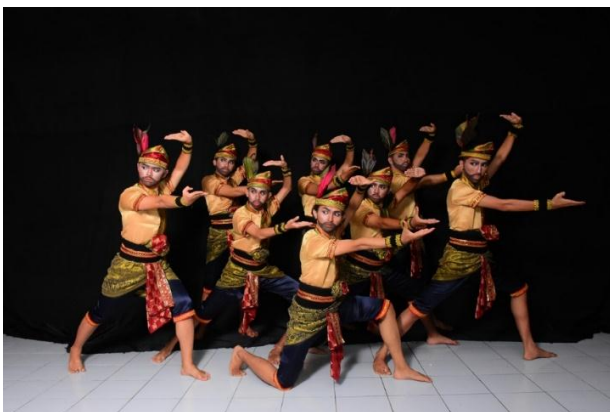
Gambar 1. Pose adegan 2 penari

Adegan 2 ini mengekspresikan tentang tentang rasa syukur karena adanya musim kemarau panjang, dampak positifnya air di sungai menjadi kering dan ikan-ikan menjadi banyak terjebak di rawa-rawa. Sehingga warga desa tidak akan kelaparan walaupun pada saat musim kemarau. Adegan 2 ini merupakan adegan tersingkat dari keseluruhan adegan, karena pembagian adegan berdasarkan suasana dari tradisi Nyerok Nanggok ini.