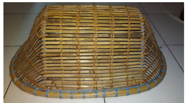
Gambar 6. Gambar tanggok

Tanggok adalah wadah yang terbuat dari rotan kemudian dijalin sehingga berbentuk lonjong dan mencembung kedalam. tanggok digunakan dengan cara dipegang oleh kedua tangan pada dua sisi bagian tengah tanggok yang kemudian diayunkan dari bawah ke atas (dari dasar sungai ke permukaan). 13