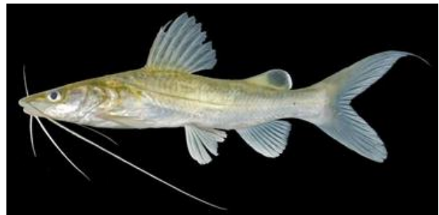
Gambar 1 : Ikan Baung

yang diinginkan belum didapat. Ikan yang sangat ditunggu-tunggu oleh masyarakat desa Kemiri ialah ikan Baung . 3 Ikan ini banyak diburu karena memiliki khasiat bagi kesehatan, salah satunya mempunyai kandungan protein yang tinggi, omega 3 dan rendah lemak, maka tak jarang masyarakat banyak memburu ikan Baung ini untuk dikonsumsi. 4