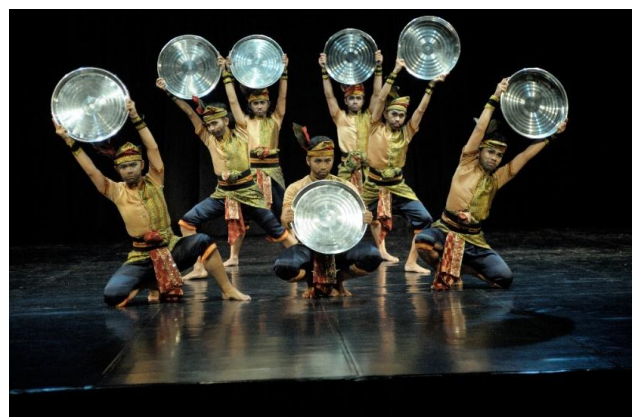
Gambar 22. Pose pada bagian akhir dari karya Nyerok Nanggok.

Bagian ending merupakan klimaks dan puncak klimaks dari karya tari Nyerok Nanggok . Properti dalam adegan ini berganti menjadi talam yang terbuat dari logam ringan berwarna perak. Pada awal adegan ini tipe tari yang digunakan ialah tipe tari studi, lalu kemudian berubah menjadi dramatik pada saat Koming masuk dari backdrop dengan menggunakan kostum ikan yang terbuat dari rotan. Koming disimbolkan sebagai ikan sebagai akhir dari tradisi Nyerok Nanggok ini. Dalam arti, ikan yang sudah dicari akhirnya tertangkap juga dan siap diolah menjadi masakan serta disantap secara bersama-sama.