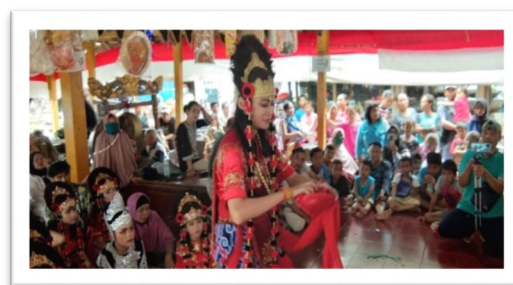
Gambar 7. Salah satu tempat pertunjukan di area pemakaman dalam acara ngunjung buyut Sunan Gunung Jati

disakralkan. Untuk acara-acara penyambutan tamu kehormatan, mengisi acara hiburan di event-event tertentu dilaksanakan sesuai dengan kebutuhan acara. Tidak ada ketentuan khusus tempat pertunjukan untuk tari topeng Klana gaya Gegesik.