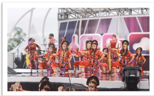
Gambar 3. Tari topeng rampak

topeng Klana, mulai dari usia 5 tahun hingga memasuki usia 60 tahun ke atas boleh menarikan tari ini jika seseorang tersebut masih sanggup untuk menari.