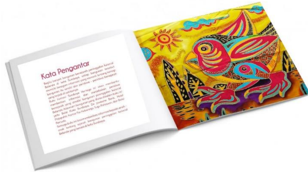
Gambar 5. Ilustrasi di dalam buku