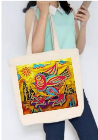
Gambar 1. Aplikasi karya pada totebag