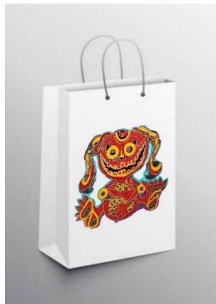
Gambar 3. Aplikasi karya pada tas kertas