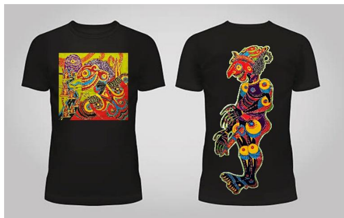
Gambar 4. Aplikasi karya pada kaos