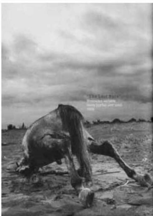
Gambar 2. Ugo Untoro, The Last Race , 2006. Dimention variable, horse, leather and sand. (Untoro, 2007)

Warna logam berkarat dapat menghilangkan kesan kertas yang rapuh menjadi terlihat kuat dan keras. Warna tersebut dapat diartikan pula sebagai sifat tunanetra dan juga sifat manusia keseluruhan. Sifat manusia yang tercipta tidak sempurna. Dalam diri manusia selalu terdapat kebaikan dan keburukan, kekuatan dan juga kelemahan.