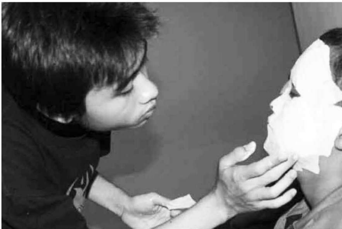
Gambar 6. Proses berinteraksi sekaligus pencetakan topeng.