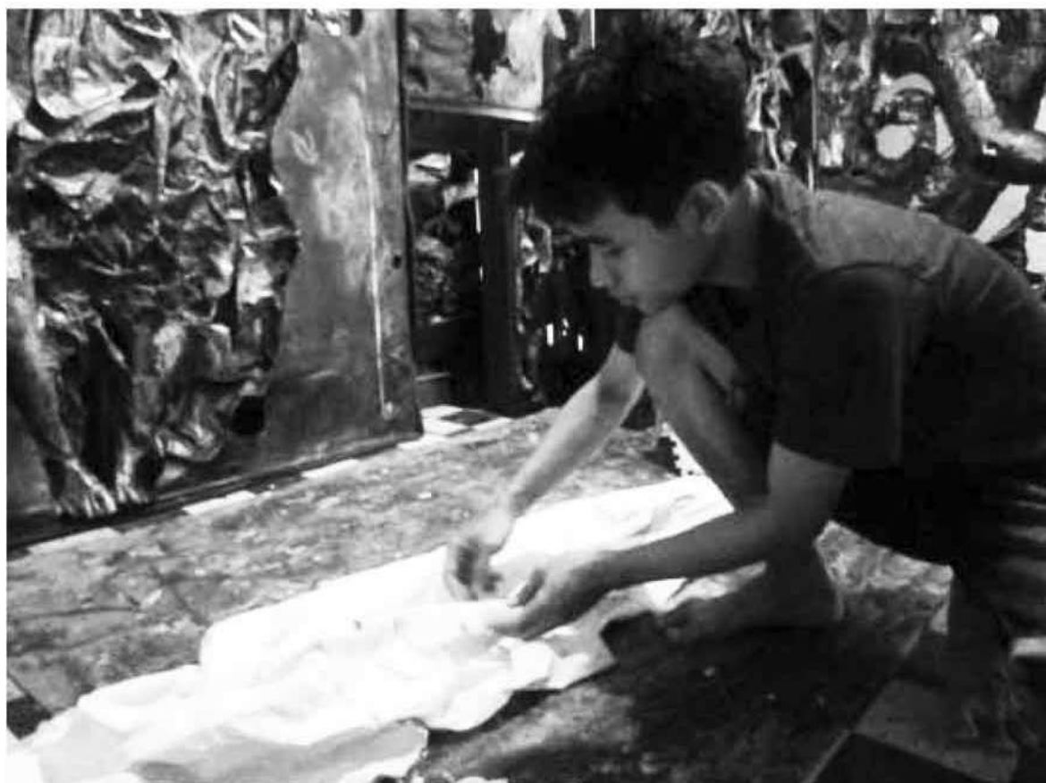
Gambar 7. Pencetakan tekstur lekukan dengan menggunakan kain sebagai model cetakan.