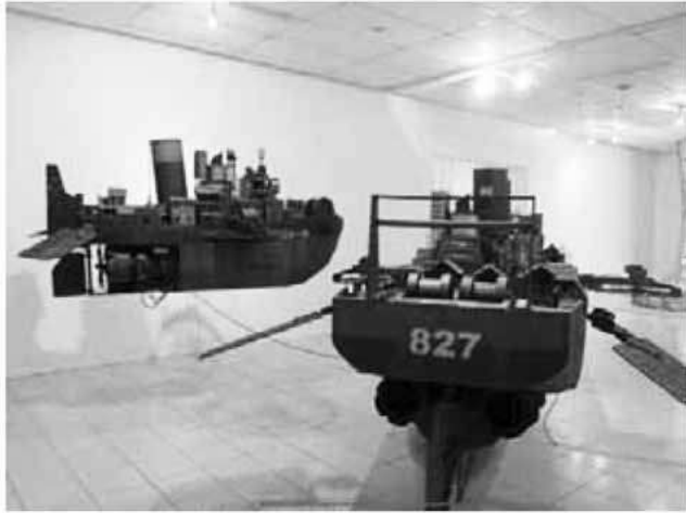
Gambar 1. Yudi Sulisty, World Without Sea , 2013

Sulisty dapat disangka sebagai logam asli. Detil objek dan juga teknik pewarnaan realistik tersebut menjadi acuan untuk diterapkan ke dalam karya tugas akhir ini. .