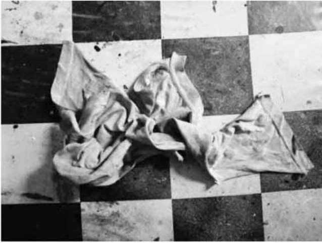
Gambar 3. Gambar lekukan kain

dari angkasa dan mampu menciptakan karya seni tanpa dukungan karya seni yang tersedia dalam masyarakatnya (Sumardjo, 2000: 84).