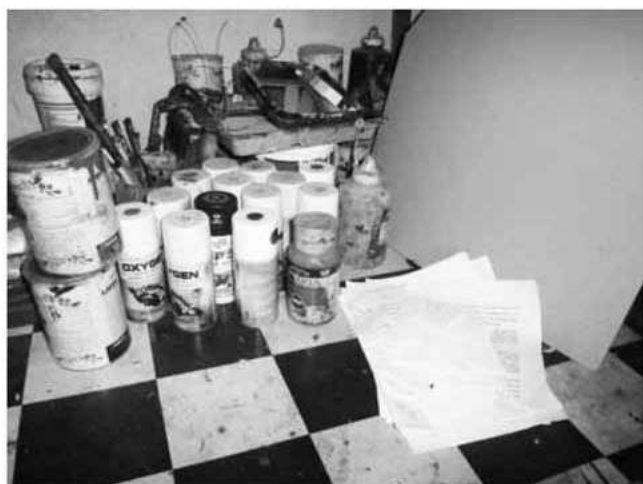
Gambar 4. Persiapan alat dan bahan.

lebih lanjut adalah menyiapkan kuas, cat, palet, kain lap dan air. Selain menyediakan alat dan bahan pada tahap persiapan juga terdapat proses perenungan, pengamatan, interaksi dan studi pustaka. Berikut pemaparan keempat hal tersebut.