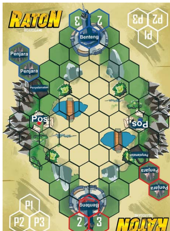
Gambar 3. Desain Papan Permainan