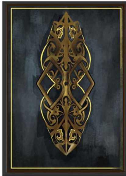
Gambar 2. Desain Backcard