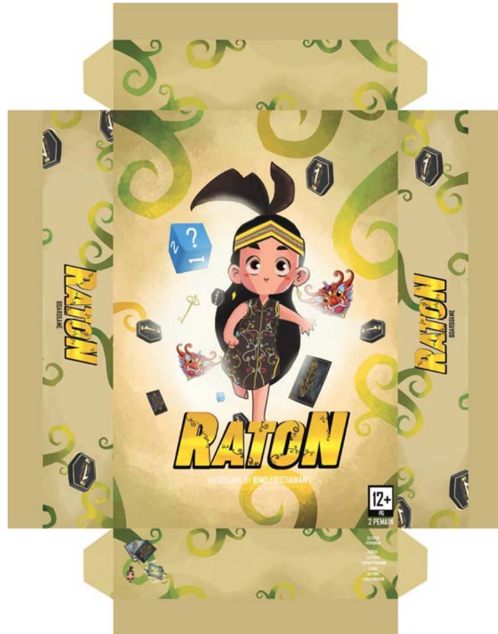
Gambar 4. Desain Packaging