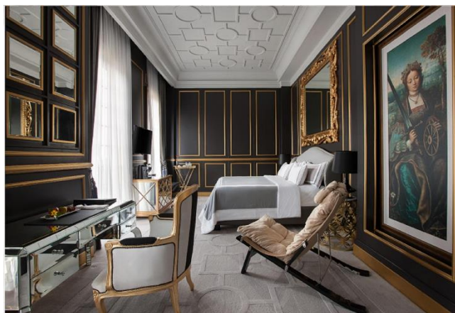
Gambar 6. Sofia Resort

Tidak perlu berpindah perusahaan, manajemen Laffayete juga memiliki resort dengan gaya yang lebih unik lagi dengan disertai lukisan-lukisan, baik dari masa klasik, romantisme, dan neoklasikisme, yaitu Sofia Resort yang tersembunyi dirimbunnya kebun di Jalan Palagan, dengan atap horizontal, penggunaan kolom yang khas, dan warna hitam sebagai warna dasar hotel ini.