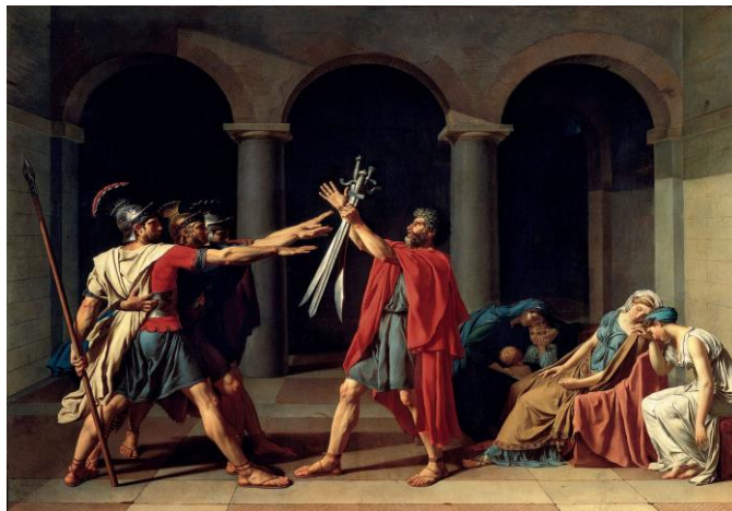
Gambar 1. Oath of Horatii (1774), Jacques-Louis David.

Maka dengan pernyataan di atas, lahirlah seni lukis modern dalam sejarah yang ditandai dengan idealisme dan isolasi diri. Jacques Louis David adalah salah satu pelopor dalam babakan lukis modern. Pada tahun 1784, David melukiskan " Oath of Horatii (Sumpah Horatii)". Dalam lukisan digambarkan Horatius, bapak yang berdiri di tengah ruangan sebagai point of interest menyumpah tiga anak laki-lakinya yang akan berangkat berperang demi Kerajaan Romawi, sementara para perempuan menangis di sebelah kanan. Lukisan ini memiliki tujuan sebagai penanaman kesadaran anggota masyarakat atas nasionalisme. Lukisan Neoklasik memiliki kecenderungan rasional, objektif, penuh dengan disiplin dan beraturan, serta bersifat klasik.