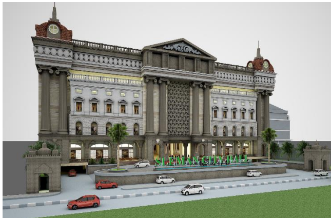
Gambar 5. Sleman City Hall