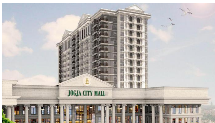
Gambar 4. Jogja City Mall

Satu pemilik dengan JCM ( Jogja City Mall ), Pak Sukeno juga merupakan pemilik pertama dari SCH atau Sleman City Hall , dengan aksent dan desain yang mirip dengan JCM, namun ada beberapa perbedaan, di mana di SCH, bangunan tampak lebih compact lagi dengan dua poin tiang utama, seolah-olah menjadi bangunan simpel dan megah.