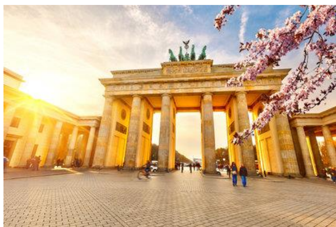
Gambar 2. Brandenburger Tor di Berlin