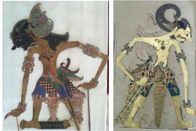
Gambar 3. Bratasena gaya Pakualaman ciptaan Paku Alam V dan gambar sebelah kanan adalah Bima pada Serat Baratayuda (St.14) pada masa Paku Alam V.