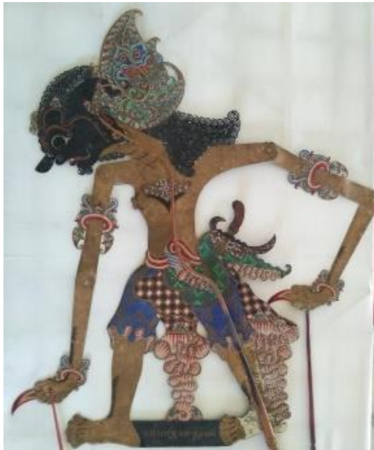
Gambar 2. Tokoh Bratasena ciptaan Paku Alam V.

Visualisasi wayang kulit Bratasena secara sekilas mirip dengan Bima, perbedaannya adalah pada bagian rambut dan sumpingannya. Wayang kulit Bratasena pada perangkat wayang Kyai Jimat adalah ciptaan dari Paku Alam V. Identifikasi tersebut dapat terlihat dari nuansa biru kehijauan yang merupakan ciri dari ciptaan wayang di masa pemerintahan Paku Alam V. Tampilan dari ciri wayang yang muncul dengan nuansa biru kehijauan juga dapat dilihat dan dibandingkan dengan gambar ilustrasi yang terdapat dalam naskah Serat Baratayuda ciptaan Paku Alam V. Dalam naskah ciptaan Paku Alam V, ilustrasi yang ada di dalamnya kebanyakan memiliki nuansa warna biru kehijauan mirip dengan artefak wayang pada masa itu.