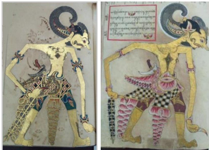
Gambar 1. Gambar ilustrasi Bima pada manuskrip Pakualaman. Gambar sebelah kiri adalah Bima pada Serat Baratayuda (St.14) pada masa Paku Alam V, sedangkan gambar sebelah kanan adalah Bima pada Serat Baratayuda (St. 11) pada masa Paku Alam II.

Penciptaan wayang kulit pada masa pemerintahan Paku Alam V dapat dikatakan mencapai puncak perkembangannya. Hal itu didasari bahwa dalam masa pemerintahan Paku Alam V, terjadi penyalinan Serat Baratayuda. Ilustrasi pada naskah tersebut digambarkan secara lebih proporsional jika dibandingkan dengan manuskrip pada periode sebelumnya. Stilisasi ilustrasi wayang dalam naskah lebih mendekati bentuk dari artefak wayang kulit yang sesungguhnya. Pelukisan ilustrasi dalam naskah juga dibuat lebih halus. Dalam ilustrasi naskah ciptaan Paku Alam V nampak kesan warna biru kehijauan yang merupakan ciri khusus dari naskah ciptaan Paku Alam V.