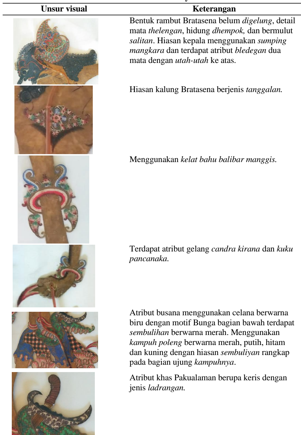
Tabel 1. Unsur Visual Bratasena Gaya Pakualaman