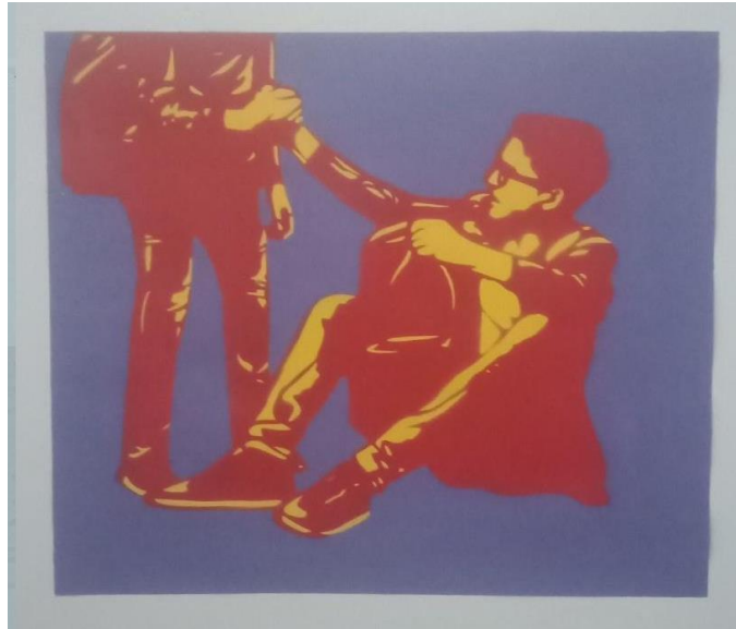
Gambar 7. Hisyam Faruq, Peduli, Lindungi , 2021. Stensil pada kertas, 31 x 35 cm