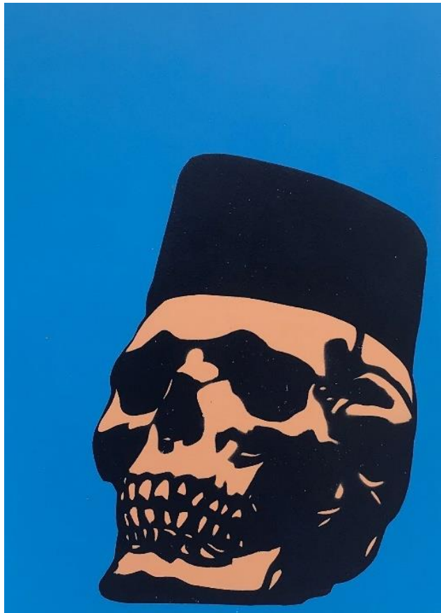
Gambar 18. Hisyam Faruq, Yang Abadi dan Yang Disesali , 2022. Stensil pada kertas, 42 x 30 cm