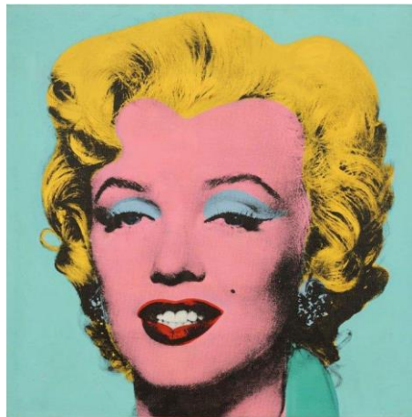
Gambar 3. Andy Warhol. Shot Sage Blue Marilyn , silkscreen, 1964, 40 x 40 inch

Andy Warhol (Andrew Warhola Jr) lahir: 6 Agustus 1928 - 22 Februari 1987, adalah seorang seniman, sutradara, dan produser Amerika yang merupakan tokoh terkemuka dalam gerakan seni visual yang dikenal sebagai seni pop. Karya Andy Warhol dapat diambil sebagai referensi dalam mewujudkan karya grafis dengan teknik stensil. Hal tersebut menjadi inspirasi dalam penyusunan warna yang menarik pada bagian bentuk objek dan background.