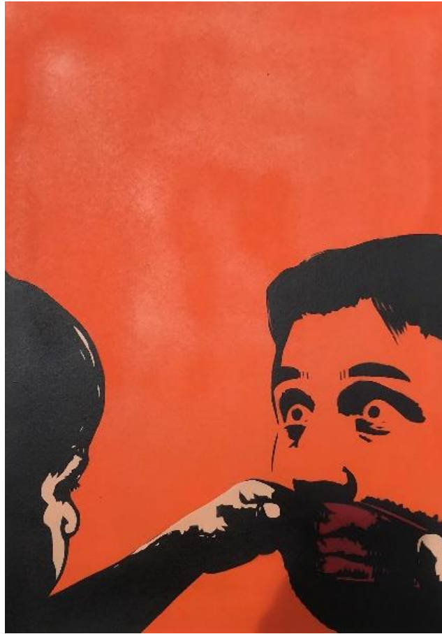
Gambar 14. Hisyam Faruq, Shut up , 2022. Stensil pada kertas, 42 x 30 cm