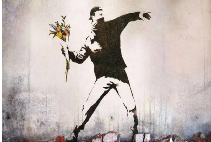
Gambar 2. Banksy. Rage, The Flower Thrower , stensil, 2005