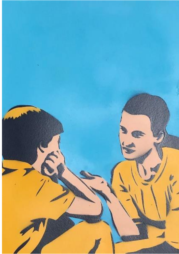
Gambar 17. Hisyam Faruq, Aku Tidak Melakukan , 2022. Stensil pada kertas, 42 x 30 cm