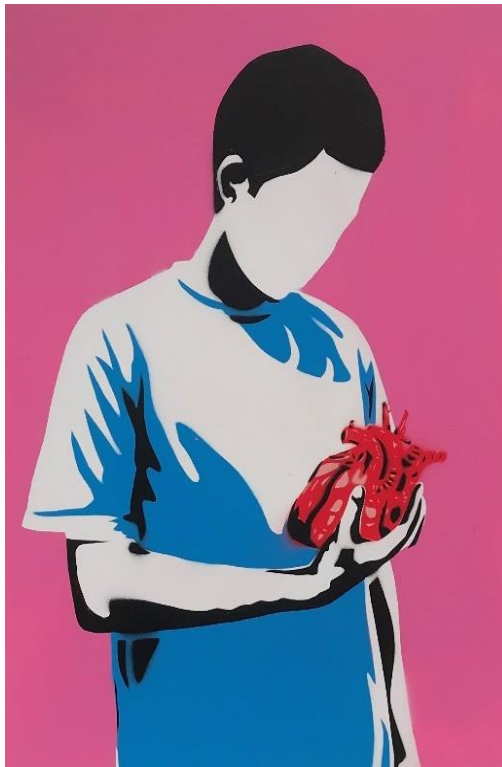
Gambar 10. Hisyam Faruq, Jangan Cederai, 2022. Stensil pada kertas, 42 x 30 cm