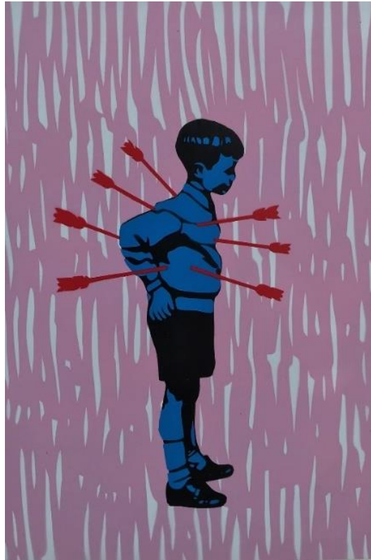
Gambar 4. Hisyam Faruq, Mental Health for Children is Important for the Future , 2022 Stensil pada kertas, 42 x 30 cm

Judul : Mental Health for Children is Important for the Future Ukuran : 42 x 30 cm Teknik : Stensil pada kertas Tahun : 2022 Edisi : 1/5