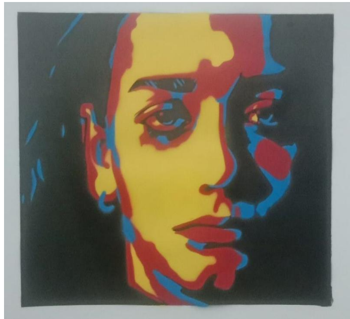
Gambar 8. Hisyam Faruq, Not all form of abuse leave bruises , 2021. Stensil pada kertas, 31 x 35 cm