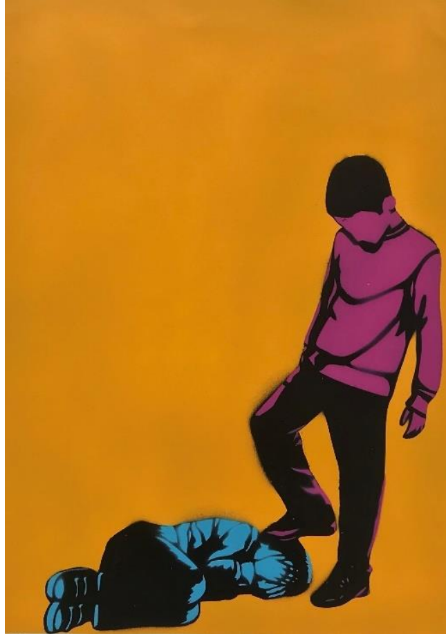
Gambar 15. Hisyam Faruq, Ruang pelampiasan , 2022. Stensil pada kertas, 42 x 30 cm

Judul : Ruang Pelampiasan Ukuran : 42 x 30 cm Teknik : Stensil pada kertas Tahun : 2022 Edisi : 3/5