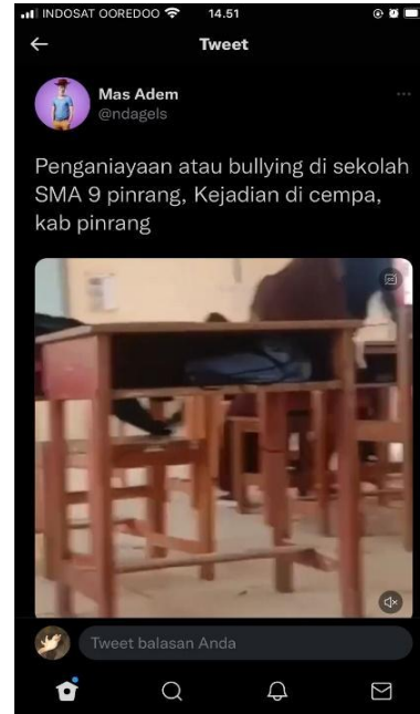
Gambar 1. Tangkapan Layar platform Twitter