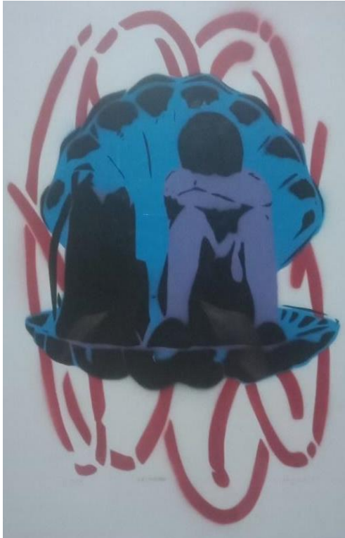
Gambar 5. Hisyam Faruq, Kau Mutiara , 2021. Stensil pada kertas, 44 x 34 cm