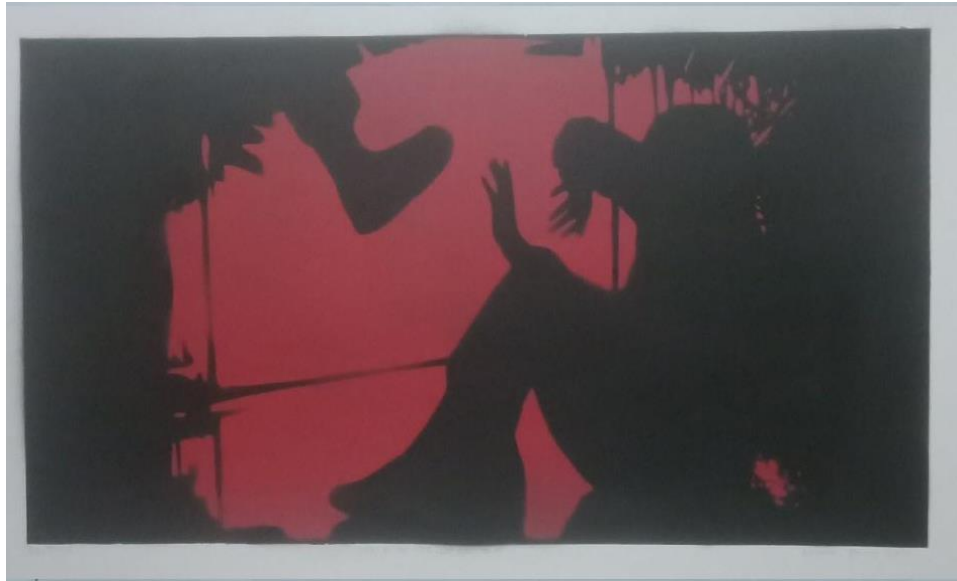
Gambar 6. Hisyam Faruq, Life is Not Fair, Get Used to it , 2021. Stensil pada kertas, 27 x 47 cm