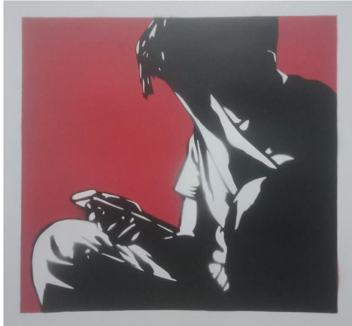
Gambar 9. Hisyam Faruq, Social media ruined my life , 2021. Stensil pada kertas, 31 x 35 cm