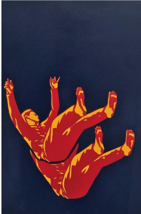
Gambar 12. Hisyam Faruq, Kehilangan yang ada didalam diri , 2022. Stensil pada kertas, 42 x 30 cm