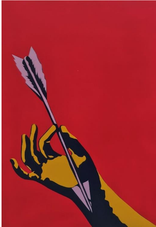
Gambar 11. Hisyam Faruq, Ada yang lebih sakit dari anak panah , 2022. Stensil pada kertas, 42 x 30 cm