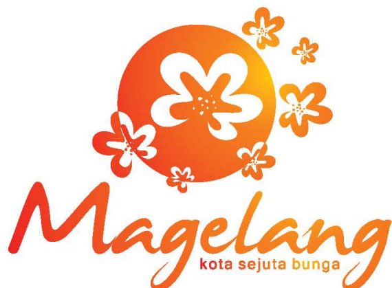
Gambar 1 Logo Magelang Kota Sejuta Bunga

Peraturan Daerah Kota Magelang Nomor 11 Tahun 2014, tentang Branding Kota.