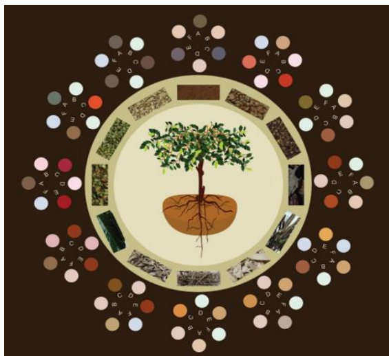
Gambar 1. 12 palet warna alami kopi robusta ( coffea canephora )

berangkat dari pohon kopi seperti pada tampilan di bawah.