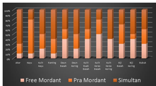
Diagram 1. Hasil kuesioner ekstrak pohon kopi robusta ( coffea canephora )

Setelah berhasil membuat pengelompokan warna pada gambar.1, selanjutnya dilakukan pengambilan data atas kecenderungan warna yang sedang diminati atau sedang trend pada saat penelitian berlangsung. Warna yang telah dihasilkan melalui eksperimen pada kain kemudian dilakukan pengujian TLW (Tingkat Luntur Warna). Namun sebelum itu dilakukan terlebih dahulu kuesioner untuk mengambil duabelas dari 72 warna, data hasil kuesioner dapat dilihat pada diagram 1.