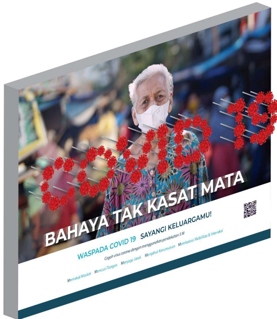
Gambar 4. Tampak perspektif

Selain gambar yang bagus, warna juga menjadi satu kesatuan dalam membuat sebuah desain perancangan. Pemilihan warna harus tepat sesuai dengan target sasaran karena unsur ini juga mempengaruhi emosi seseorang untuk mengambil keputusan. Warna dominan yang digunakan dalam perancangan adalah mengacu pada tone and manner perancangan yaitu Arrest Attention dan Reaction . Warna yang diambil adalah warna-warna berani dan disesuaikan dengan warna latar gambar agar tidak terlihat mati. Gambar 3