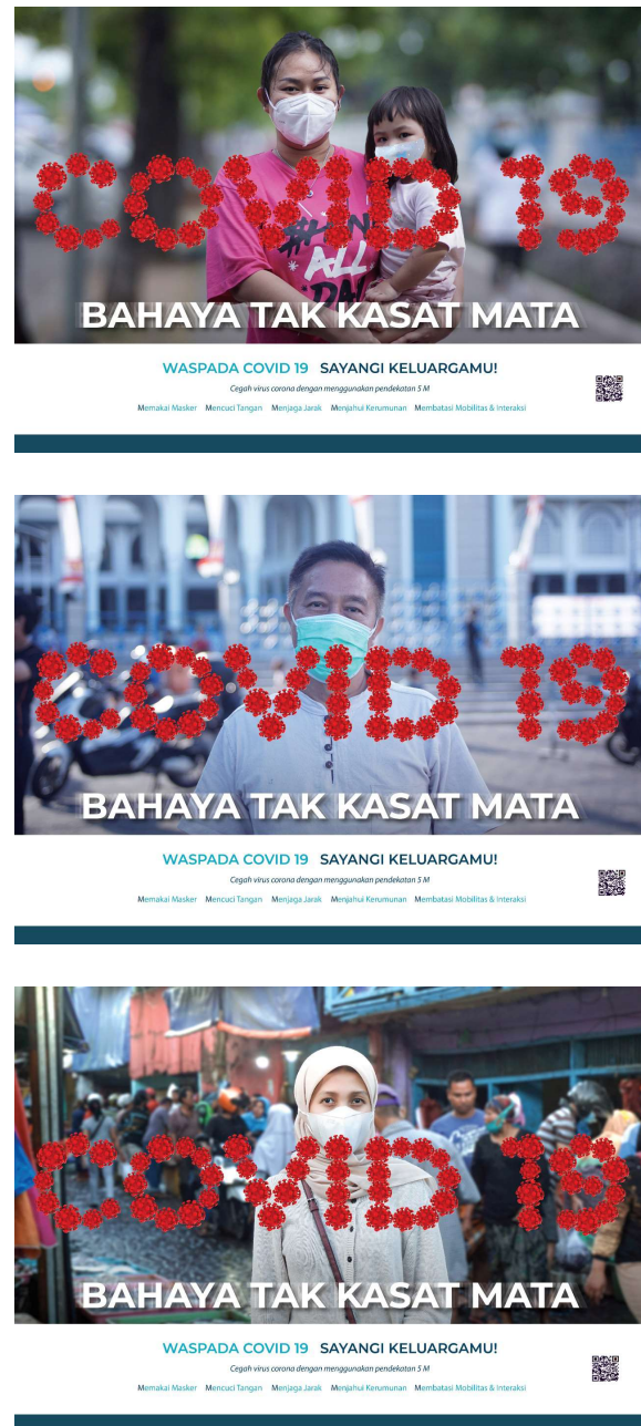
Gambar 3. Hasil desain

dengan memanfaatkan benda-benda yang ada di ruang publik agar memberikan efek suasana kewaspadaan. Setiap desain ambient media yang dibuat diberikan QR Code yang langsung terhubung dengan website informasi Covid-19 milik Pemerintah Kota Surabaya dimana berisi informasi seputar kasus Covid-19.