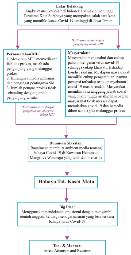
Gambar 2. Konsep perancangan

Konsep perancangan yang didapat adalah penemuan keyword sebagai pedoman perancangan. Keyword tersebut adalah “Bahaya Tak Kasat Mata” (Gambar 2).