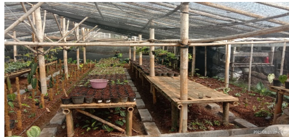
Gambar 2. Tempat budidaya tanaman hias milik warga Desa Ciwalen