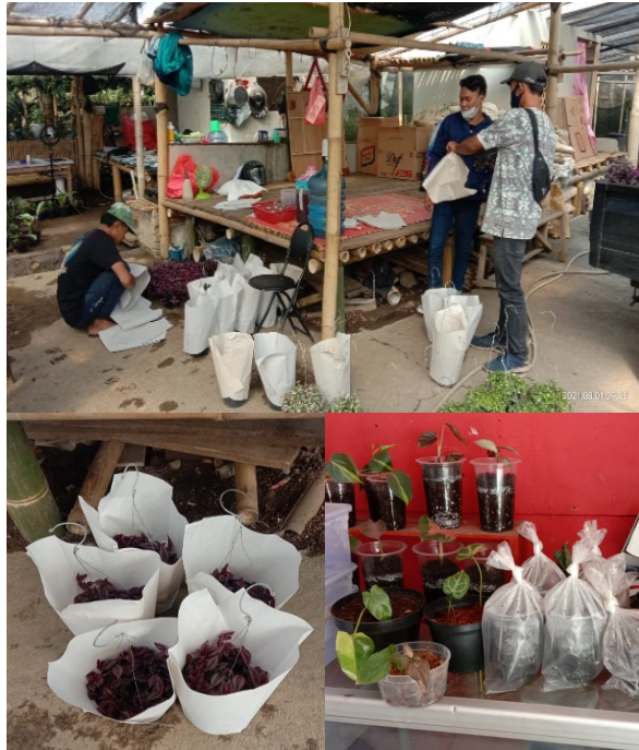
Gambar 4. Kemasan tanaman hias milik warga Desa Ciwalen

pedagang tanaman hias semata-mata hanya mengandalkan keindahan bunganya saja. Sementara Untuk penggunaan kemasan ( packaging ) dan branding dalam meningkatkan nilai tambah belum ada sama sekali. Bahkan penggunaan merek atau nama untuk toko bunganya juga tidak ada.