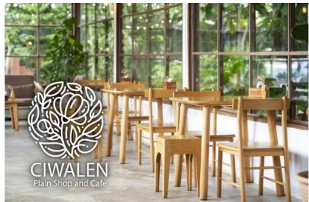
Gambar 8. Area indoor Sentra Penjualan CIWALEN Plain Shop and Cafe