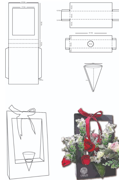
Gambar 11. Desain manual dan desain akhir kemasan model jinjing (Sumber: Dokumentasi Penulis)

dapat melindungi dan dibawa-bawa, juga menambahkan kesan menarik pada bagian kemasan. Hasil penelitian ini menawarkan dua model kemasan, yaitu model kubus kerucut (lihat Gambar 10) dan model jinjing (lihat Gambar 11). Untuk model kubus kerucut, dengan desain yang simpel berbentuk kubus dan kerucut dengan warna natural coklat dan hitam tampak terlihat elegan. Dengan berbahan karton dan