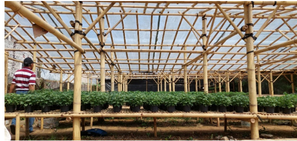
Gambar 1. Tempat budidaya tanaman hias milik warga Desa Ciwalen

Saat ini tanaman pot hias yang dibeli konsumen langsung dalam bentuk tanaman pot saja atau yang sudah dikemas dengan menggunakan kertas