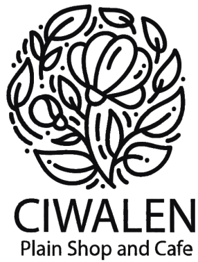
Gambar 6. Logo Sentra Penjualan CIWALEN Plain Shop and Cafe

Sementara, petani yang berskala kecil, cukup mengandalkan konsumen yang datang ke lokasi pembudidayaan atau teras-teras halaman rumah yang dijadikan etalase penjualannya. Mereka hanya menunggu, dan tujuannya hanya sekedar terjual tanaman hiasnya.