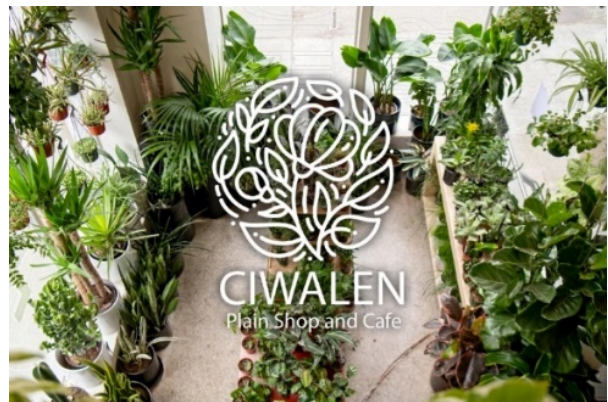
Gambar 9. Area outdoor Sentra Penjualan CIWALEN Plain Shop and Cafe

dengan meja dan kursi kayu sederhana (lihat Gambar 8). Area ini memfasilitasi para calon pembeli bunga untuk duduk-duduk santai sejenak sambil melihat-lihat display tanaman hias yang ada di beberapa titik yang sengaja disajikan untuk mengundang ketertarikan dan merasakan suasana taman dengan bunga-bunga yang indah. Sambil menikmati