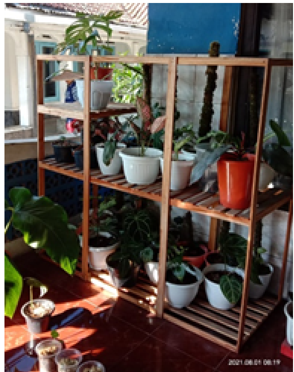
Gambar 3. Etalase tanaman hias milik warga Desa Ciwalen

pembungkus tanpa adanya merek atau branding penjual (seperti tampak pada Gambar 4). Petani atau