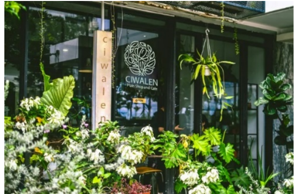
Gambar 7. Tampilan Sentra Penjualan CIWALEN Plain Shop and Cafe

Perancangan Sentra Penjualan CIWALEN ini terbagi menjadi dua area, yaitu area indoor atau bagian tengah yang diperuntukkan sebagai café/kedai