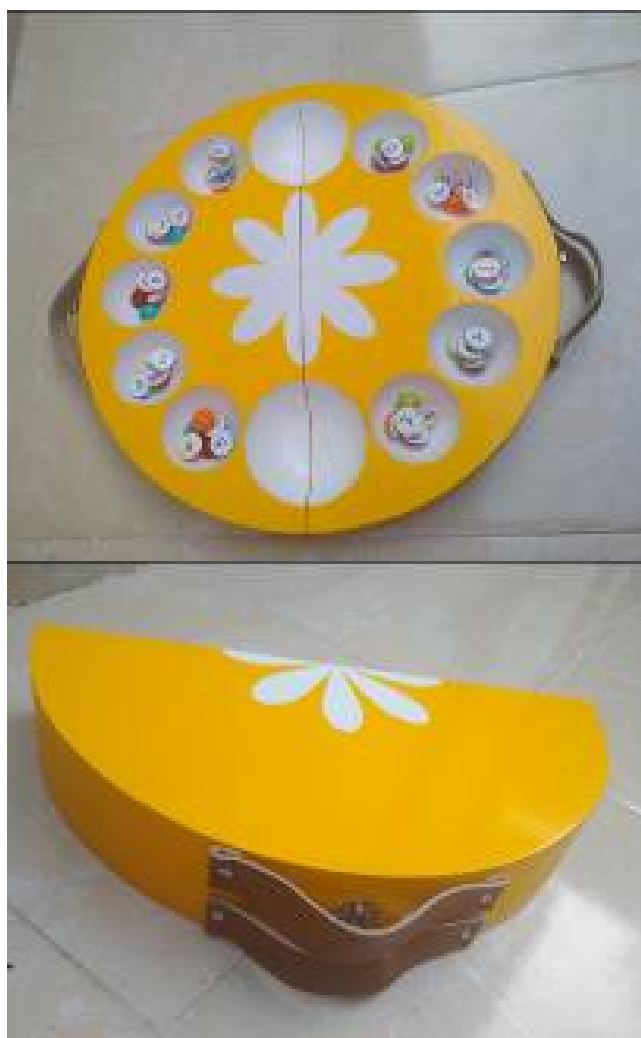
Gambar 5. Dakon desain baru berbentuk jeruk

Salah satu desain dakon yang baru, tampak pada Gambar 5. Desain tersebut terinspirasi pada bentuk buah jeruk, yang berbentuk bulat berwarna kuning dengan biji dakon berwarna-warni.