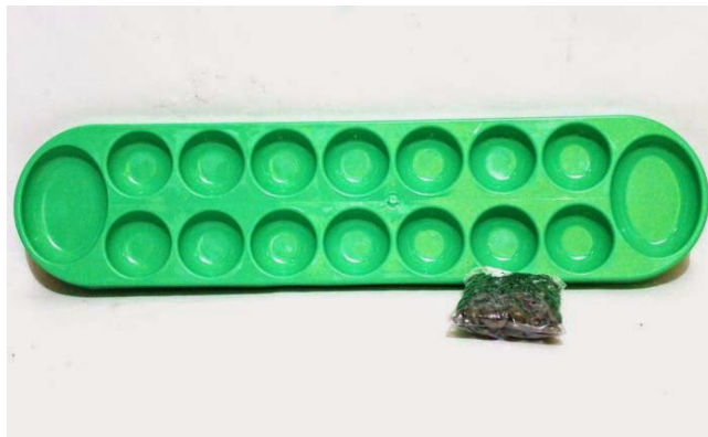
Gambar 4. Dakon berbahan plastik