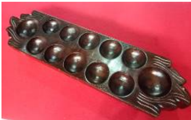
Gambar 2. Dakon bentuk daun berbahan kayu Koleksi Sulis Gallery Pusaka