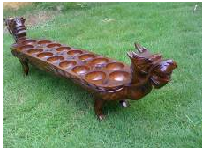
Gambar 1. Dakon bentuk naga berbahan kayu

Setelah melalui beberapa proses tahapan penelitian di lapangan akhirnya peneliti memilih untuk fokus menggarap atau mere-desain mainan tradisional anak-anak dakon, dengan alasan bahwa permainan dakon ini sebetulnya simpel akan tetapi filosofi didalam permainannya sangat sarat makna, sehingga sangat bagus untuk meningkatkan kecerdasan anak. Dalam permainan ini didapati penuh dengan teknik, langkah, hitungan, dan lain sebagainya. Dimana pada hasil re-desain ini lebih memasukkan unsur-unsur baru yang belum ada dari mainan dakon yang sudah ada sebelumnya. Dalam perancangan ini dipilih tema Pop Art dengan tujuan agar hasilnya dapat dinikmati oleh anak-anak, khususnya anak-anak usia antara 3-5 th. Tema Pop Art , tentunya sangat menarik bagi anak-anak karena warna-warna yang lebih mencolok sehingga sambil bermain, anak dapat belajar mengenal warna. Pop Art adalah aliran seni yang memanfaatkan simbol-simbol dan gaya visual yang berasal dari media massa yang populer seperti koran, tv, iklan dll. Ciri pop art adalah eksperimen melalui tampilan bentuk yang terkesan tidak serius, dangkal, dan penuh dengan main-main (Dawami, 2017; Wardana, 2012). Warna Pop Art bercirikan kombinasi warna-warna yang berani. Warna Pop Art sangat sesuai dengan dunia anak-anak yang penuh dengan permainan dan colorful .