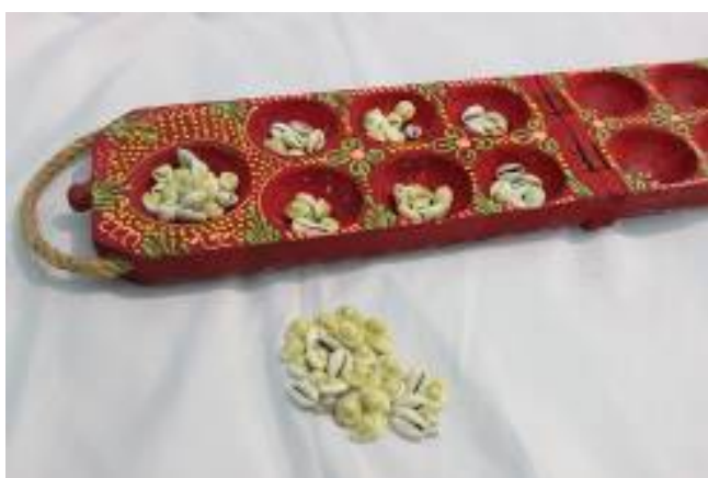
Gambar 3. Dakon kayu bercorak batik

Prinsip permainan ini sama dengan permainan dakon pada umumnya. Akan tetapi pada biji dakon, dibuat berbeda dari biji dakon pada umumnya. Dalam permainan dakon yang sudah ada sebelumnya, menggunakan biji dakon dari manik-manik berbentuk keong, ada juga yang menggunakan biji sawo atau sering disebut juga kecik . Tetapi dalam karya dakon ini digunakan biji berbahan kayu, dengan bentuk \frac{1}{2} lingkaran, dengan warna-warna cerah dan pada sebagian lain dibubuhi angka 1-5. Warna-warni ini bertujuan untuk pengenalan warna dan pada biji angka 1-5 bertujuan agar anak dapat mengenal angka dari 1-5. Sambil bermain, mengenal warna, bentuk dan sedikit mengenal angka. Dari penelitian ini dihasilkan desain baru sebanyak 6 buah, dan 2 buah prototipe dengan menggunakan kayu sebagai bahan dasarnya.