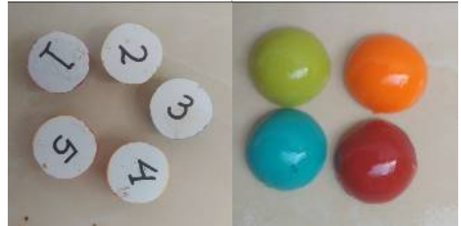
Gambar 8. Biji dakon desain baru