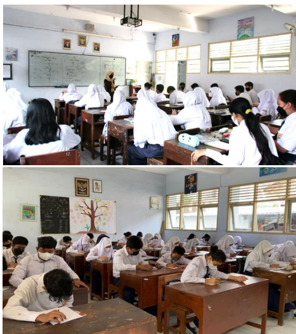
Gambar 3. Proses Ulangan Harian secara Luring

sehingga perlu ulangan harian susulan untuk siswa yang tidak mengikuti pada jadwal semestinya. Kendala evaluasi luring terlihat pada beberapa siswa yang tidak membawa headset atau earphone , ini menyebabkan suasana kelas kurang kondusif karena suara dari video terdengar dari bermacam titik sumber dan bersaut-sautan saat ulangan harian berlangsung.