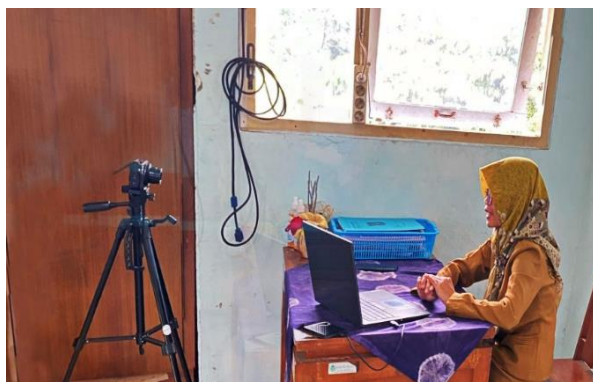
Gambar 1. Proses Pengambilan Video oleh Guru

Pada proses editing , guru menambahkan beberapa komponen media seperti gambar, video tarian, teks, suara latar, dan nomor instrumen penilaian. Setelah pembuatan video evaluasi selesai, maka diperoleh durasi selama 30 menit.