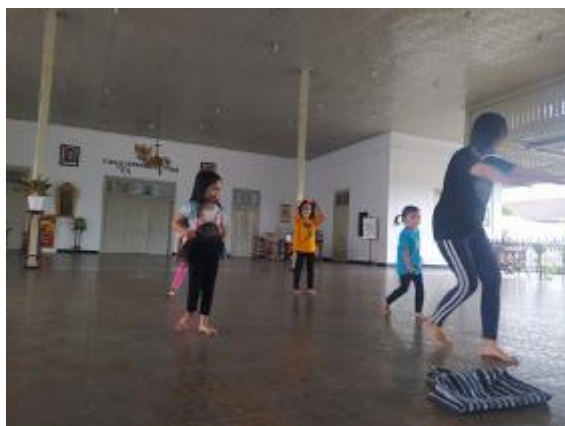
Fig. 3. Memberikan Contoh Motif Gerak Ulurkan Tangan

“Tari Sahabat Anak merupakan tarian yang memberikan semangat kepada anak-anak untuk bergerak dengan riang dan gembira. Kegembiraan itu bukan hanya untuk diri sendiri, tapi saling bergandengan tangan untuk bergembira bersama. Keceriaan dan keriang-an anak-anak juga dapat memberikan energi positif untuk orang-orang disekitarnya, mari bergembira bersama kami”.