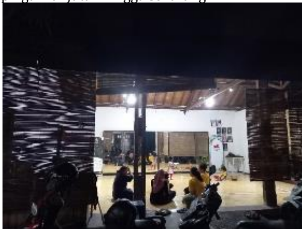
Fig. 1. Ruang Belajar Tari Sanggar Seni Kinanti Sekar Yogyakarta

Sanggar Seni Kinanti Sekar Yogyakarta pada Tahun 2017 bergabung menjadi penerima manfaat program Creative Youth at the Indonesian heritage sites UNESCO Jakarta dan mendapatkan pendampingan pengembangan usahanya. Pada tahun 2018 sanggar ini menenangkan kompetisi Youth Creative Competition yang diselenggarakan UNESCO dan mendapatkan pendampingan lanjutan hingga sekarang.