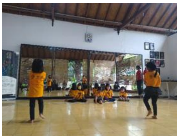
Fig. 6. Foto Proses Pembelajaran Tari Sahabat Anak

Pembelajaran Tari Sahabat Anak merupakan tingkatan pertama dalam tari kreasi anak usia dini. Tarian ini mengajarkan peserta didik untuk menari sambil bernyanyi. Kegiatan pembelajaran Tari Sahabat Anak dilakukan dengan delapan kali pertemuan dengan langkah-langkah pembelajaran yang meliputi kegiatan pembuka, inti, dan penutup. 1) kegiatan pembuka yaitu kegiatan yang dilakukan untuk membuat peserta didik lebih fokus dalam pembelajaran dan menyiapkan peserta didik baik secara psikis dan fisik agar proses pembelajaran tari berjalan dengan baik. Kegiatan pembuka diawali dengan mengisi presensi, baca doa, yel-yel SSKS (Sanggar Seni Kinanti Sekar), dan pemanasan. 2) kegiatan inti merupakan kegiatan pokok yang berfokus dalam pengembangan sikap, pengetahuan, dan keterampilan. Sebelum memasuki kegiatan inti diberikan waktu untuk istirahat dikarenakan sehabis melakukan pemanasan. Setelah itu pemberian materi pembelajaran Tari Sahabat Anak dimulai dari bernyanyi terlebih dahulu di pertemuan berikutnya dilakukannya pembelajaran tari secara bertahap. 3) kegiatan penutup yang dilakukan dalam rangka evaluasi kegiatan pembelajaran tari yang sudah berlangsung selama satu jam. Setelah pembelajaran selesai, dilakukannya penutup untuk memberikan evaluasi terhadap pembelajaran yang berupa arahan untuk berlatih dengan baik dan percaya diri.