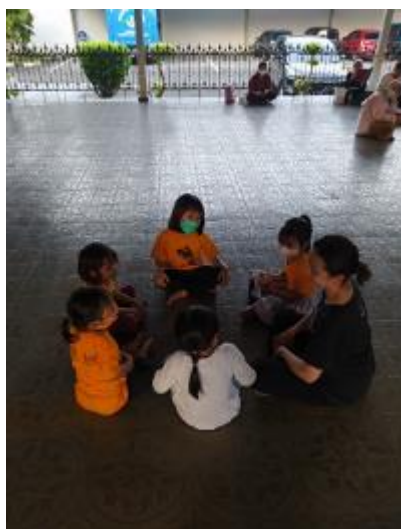
Fig. 4. Foto Menerangkan Materi Tari Sahabat Anak

Pembelajaran Tari Sahabat Anak dilakukan selama kurang lebih 1 jam setiap pertemuan. Setiap pertemuan dilakukan pengulangan materi dengan tujuan agar menanamkan kebiasaan-kebiasaan yang dapat meningkatkan ketangkasan dan keterampilan. Setelah pembelajaran berakhir diberikan evaluasi dengan mengevaluasi berupa motif dan ragam gerak yang masih kurang baik dilakukan.