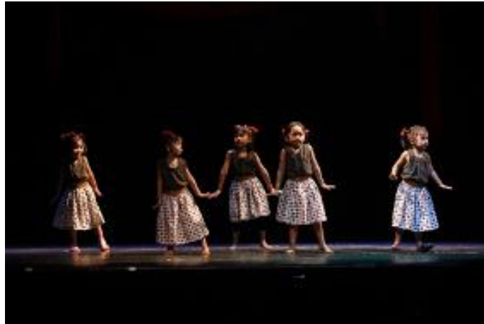
Fig. 7. Foto Pementasan Tari Sahabat Anak