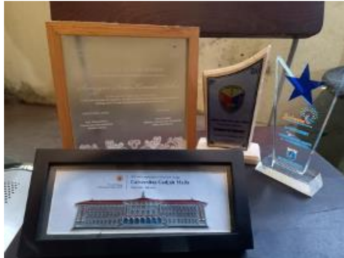
Fig. 2. Foto Penghargaan dari UNESCO