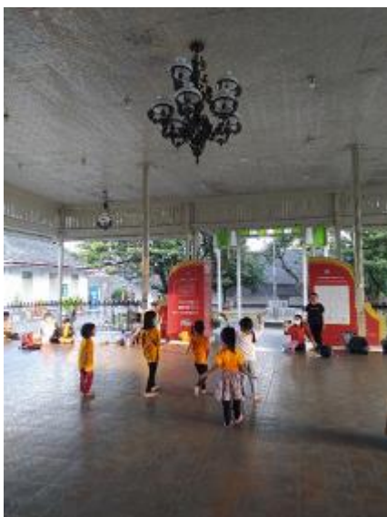
Fig. 5. Foto Pembelajaran Tari Sahabat Anak

Pembelajaran Tari Sahabat Anak merupakan tingkatan pertama dalam tari kreasi anak usia dini. Tarian ini mengajarkan peserta didik untuk menari sambil bernyanyi. Kegiatan pembelajaran Tari Sahabat Anak dilakukan dengan delapan kali pertemuan dengan langkah-langkah pembelajaran yang meliputi kegiatan pembuka, inti, dan penutup. 1) kegiatan pembuka yaitu kegiatan yang dilakukan untuk membuat peserta didik lebih fokus dalam pembelajaran dan menyiapkan peserta didik baik secara psikis dan fisik agar proses pembelajaran tari berjalan dengan baik. Kegiatan pembuka diawali dengan mengisi presensi, baca doa, yel-yel SSKS (Sanggar Seni Kinanti Sekar), dan pemanasan. 2) kegiatan inti merupakan kegiatan pokok yang berfokus dalam pengembangan sikap, pengetahuan, dan keterampilan. Sebelum memasuki kegiatan inti diberikan waktu untuk istirahat dikarenakan sehabis melakukan pemanasan. Setelah itu pemberian materi pembelajaran Tari Sahabat Anak dimulai dari bernyanyi terlebih dahulu di pertemuan berikutnya dilakukannya pembelajaran tari secara bertahap. 3) kegiatan penutup yang dilakukan dalam rangka evaluasi kegiatan pembelajaran tari yang sudah berlangsung selama satu jam. Setelah pembelajaran selesai, dilakukannya penutup untuk memberikan evaluasi terhadap pembelajaran yang berupa arahan untuk berlatih dengan baik dan percaya diri.