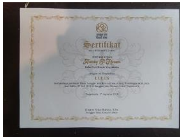
Fig. 8. Foto Sertifikat Kelulusan Tari