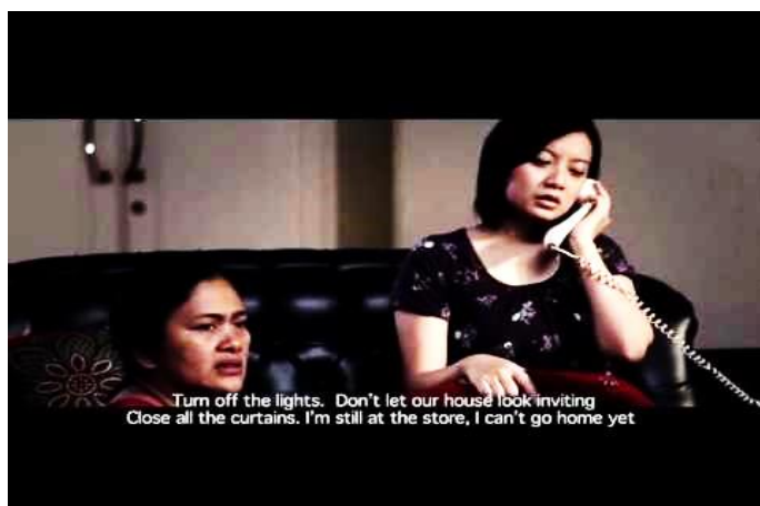
Fig. 1. Kisah Tragedi Mei: Fang Yin (Youtube, Kabari TV, 2013)

Pertunjukan teater oleh teater Karoeng, Bogor pada tahun 2019 yang menjadi tinjauan karya. Teater Karoeng merancang konsep pertunjukan dengan memvisualisasikan Jakarta di era 1998 dengan mengemas pertunjukan dengan setting koran-koran yang mendominasi di bagian backdrop . Hal ini menjadi tinjauan bagi penulis untuk mengembangkan pertunjukan dengan menggunakan teknologi immersive dengan bentuk animasi sebagai pendukung suasana pertunjukan.