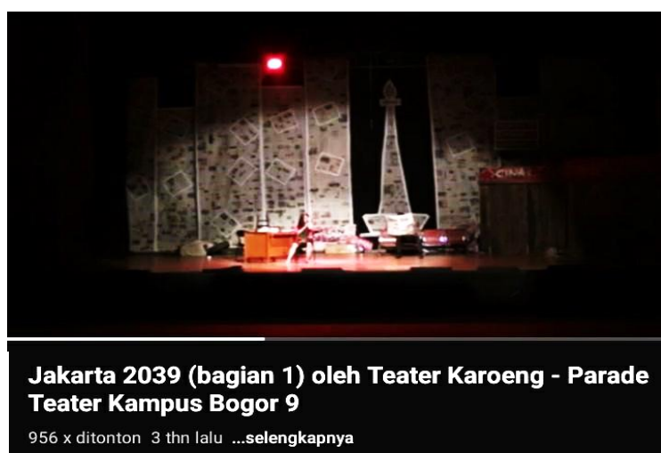
Fig. 2. Jakarta 2039 (Youtube, Fokus Teater Bogor, 2019)

Pertunjukan teater oleh teater Karoeng, Bogor pada tahun 2019 yang menjadi tinjauan karya. Teater Karoeng merancang konsep pertunjukan dengan memvisualisasikan Jakarta di era 1998 dengan mengemas pertunjukan dengan setting koran-koran yang mendominasi di bagian backdrop . Hal ini menjadi tinjauan bagi penulis untuk mengembangkan pertunjukan dengan menggunakan teknologi immersive dengan bentuk animasi sebagai pendukung suasana pertunjukan.