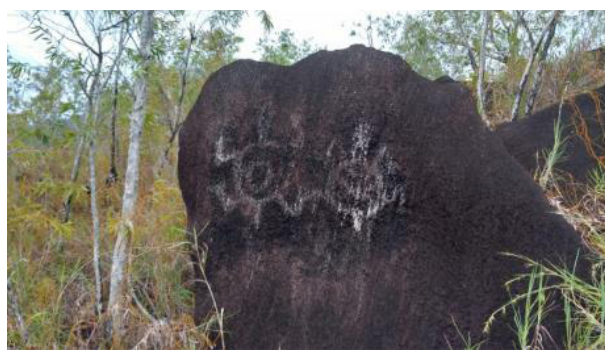
Gambar 2. Motif kura-kura di sektor 2 Situs Megalitik Tutari.

Tiga orang penari memilih masing-masing satu motif yang terlukis di atas batu, kemudian menginterpretasikannya sesuai pengalaman artistik dan ketubuhan masing-masing. Penulis membebaskan penari menginterpretasikan motif yang dipilih sembari sesekali memberikan masukan dan evaluasi. Eksplorasi rangsang visual ini bertujuan untuk menyatukan rasa antara tubuh penari dengan karakter motif yang