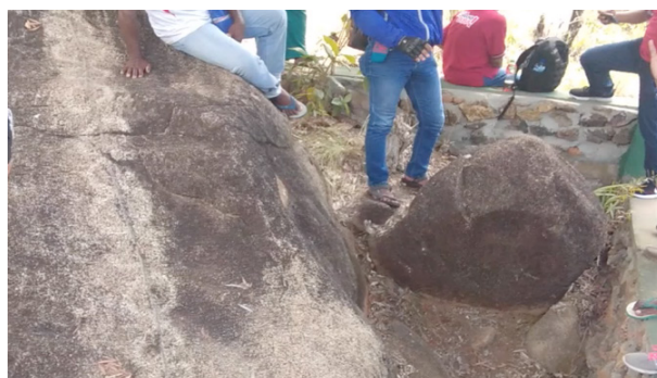
Gambar 4. Motif gelang batu mas kawin di sektor 3 Situs Megalitik Tutari.