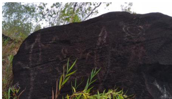
Gambar 3. Motif fauna berupa soa-soa dan kura-kura di sektor 2 Situs Megalitik Tutari.