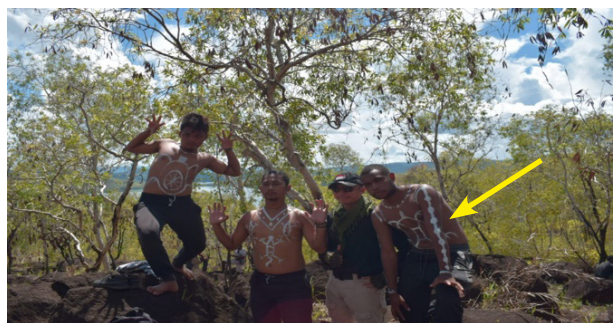
Gambar 5. Eksplorasi di Sektor 3 Situs Tutari bersama penari sekaligus mencoba aplikasi motif body painting baru pada bagian tangan penari.

Inspirasi gagasan ini timbul dari proses wawancara bersama beberapa narasumber. Narasumber pertama adalah Hari Suroto